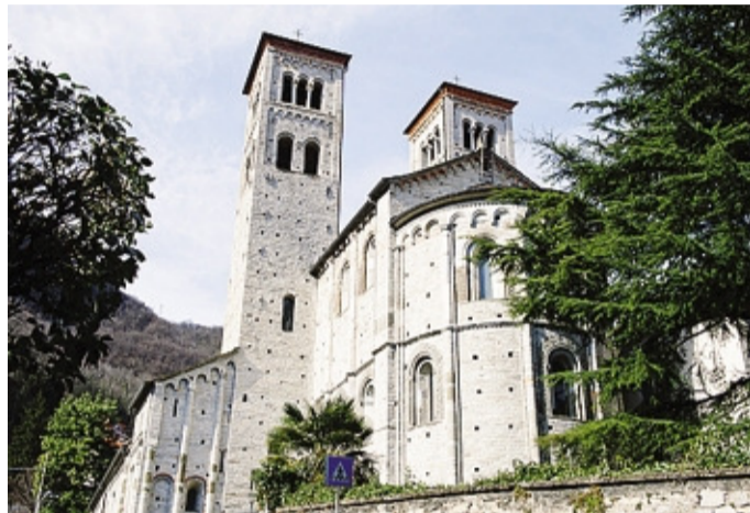
L'appuntamento è fissato per domani sera alle 20.45 a Sant'Abbondio

«È una tradizione proporre ogni anno un momento di riflessione sulle complesse problemati-